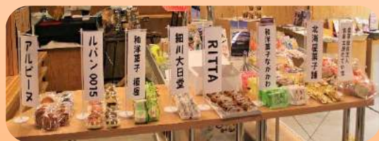
※写真は第1回協賛品です。

ワールドカフェに関わられた皆様には感謝申し上げます。本当にありがとうございました。