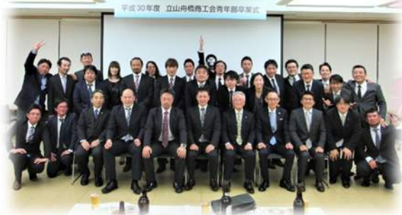
卒業生の皆さん、ありがとうございました!